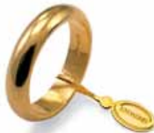
Classica oro giallo Gr. 10,0