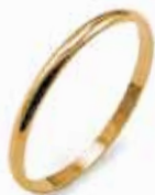
Fermanello oro giallo Gr. 0,8