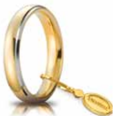
Comoda oro giallo bordi bianchi rodiati 4 mm