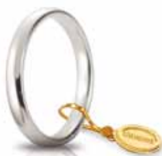
Comoda oro bianco 3 mm