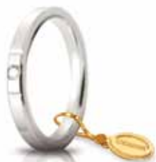
Oro bianco 2,5 mm ct. 0.03