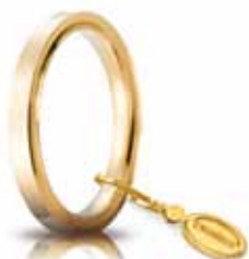
Oro giallo 2,5 mm