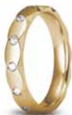
Classica oro giallo ct. 0.26