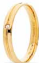
Oro giallo ct. 0.02