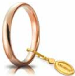
Comoda oro rosso 3 mm