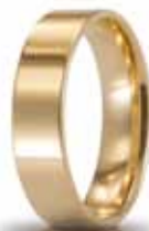
Oro giallo 5 mm