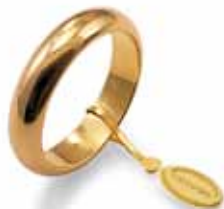
Classica oro giallo Gr. 8,0