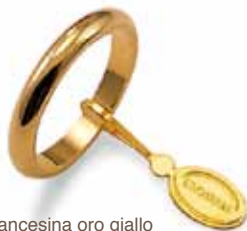
Francesina oro giallo Gr. 4,0