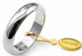
Classica oro bianco Gr. 7,0

Il simbolo prezioso dell'unione, lo stesso che la rappresenta in una forma costante e perfetta: senza inizio e senza fine, per tutta la vita.