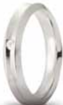
Oro bianco ct. 0.02