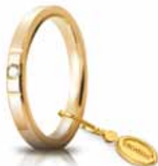
Oro giallo 2,5 mm ct. 0.03