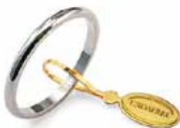
Francesina oro bianco Gr. 1,5