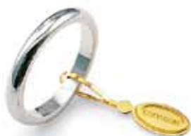
Francesina oro bianco Gr. 4,0