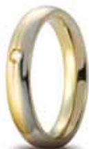
Eclissi oro bicolore 4 mm ct. 0.03