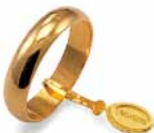
Larga oro giallo Gr. 5,0