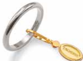
Francesina oro bianco Gr. 3,0