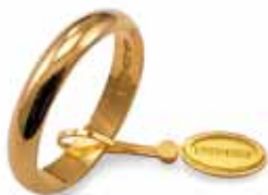
Classica oro giallo Gr. 3,0