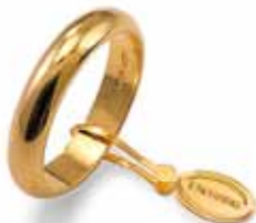
Classica oro giallo Gr. 6,0