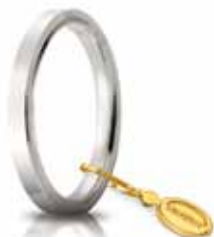
Oro bianco 2,5 mm