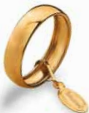
Light 5 mm in oro giallo Gr. da 2,6 a 3,0