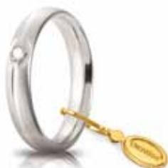
Comoda satinata oro bianco ct. 0.03