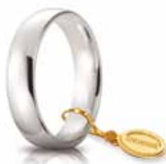
Comoda oro bianco 5 mm

In tutti i modelli, lo spessore e la larghezza degli anelli rimangono costanti indipendentemente dalla misura sia per lui che per lei.