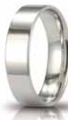
Oro bianco 5 mm