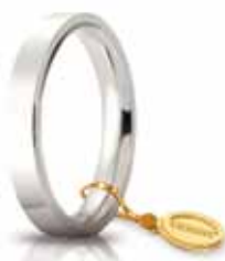
Oro bianco 3,5 mm