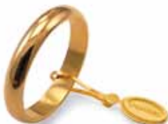
Classica oro giallo Gr. 4,0