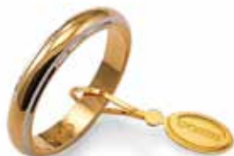
Classica bordi bianchi rodiati Gr. 5,0