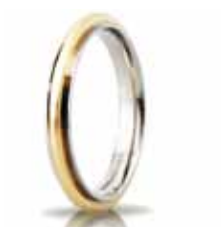
"Slim" oro bicolore