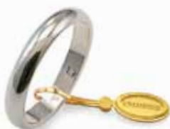
Classica oro bianco Gr. 4,0