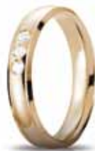
Oro giallo ct. 0.09