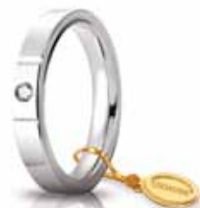
Oro bianco 3,5 mm ct. 0.05

La linea Cerchi di Luce è una elegante interpretazione delle fedi comode UNOAEERRE, impreziosite dalla luminosità dei diamanti e dalla ricercatezza del design. Tutte le fedi Cerchi di Luce sono arricchite da un raffinato sigillo UNOAEERRE in oro giallo.