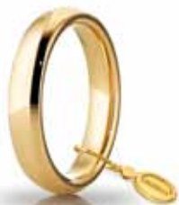
Comoda oro giallo 4 mm