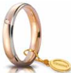
Comoda oro rosso bordi bianchi rodiati 4 mm ct. 0.03