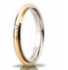
"Slim" oro bicolore ct. 0.01