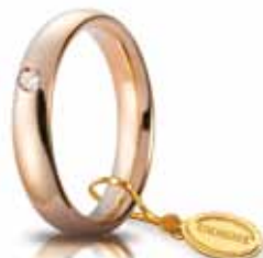
Comoda oro rosso 4 mm ct. 0.05