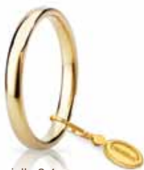
Comoda oro giallo 2,4 mm