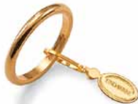
Francesina oro giallo Gr. 3,0