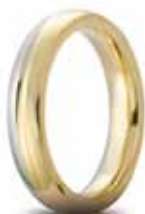
Eclissi oro bicolore 4 mm