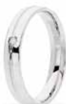
Oro bianco ct. 0.02