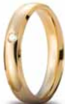
Oro giallo ct. 0.03