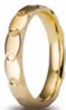
Classica oro giallo