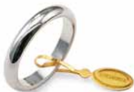
Classica oro bianco Gr. 5,0