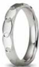
Classica oro bianco