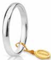
Comoda oro bianco 2,4 mm