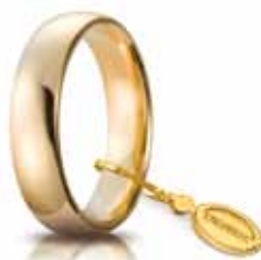
Comoda oro giallo 5 mm

Un anello che unisce l'amore al comfort. UNOAERRE ha creato "Comoda", la fede unica come il blocco di oro dal quale nasce senza saldature modellata da una punta di diamante. Un cerchio perfetto che non si interrompe mai.