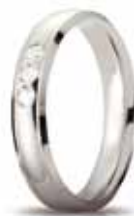
Oro bianco ct. 0.09