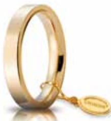
Oro giallo 3,5 mm