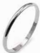
Fermanello oro bianco Gr. 0,8