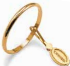
Francesina oro giallo Gr. 1,5