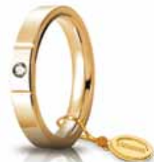
Oro giallo 3,5 mm ct. 0.05