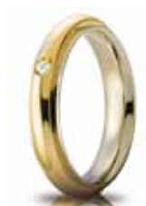
Oro bicolore ct. 0.03

Brillanti Promesse, la nuova collezione di fedi con diamante, è stata realizzata per soddisfare il desiderio di fedi sempre più preziose riaffermando il primato che UNOERRE da sempre detiene.