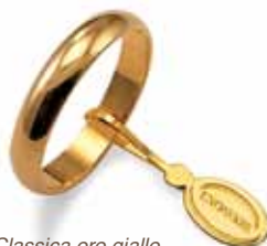
Classica oro giallo Gr. 5,0