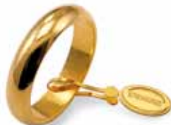
Classica oro giallo Gr. 7,0