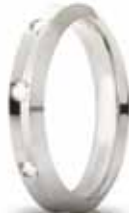
Oro bianco ct. 0.16