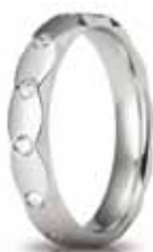
Classica oro bianco ct. 0.26