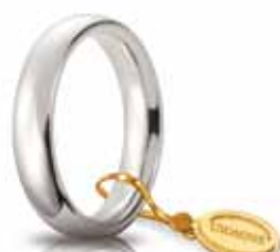
Comoda oro bianco 4 mm