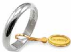
Classica oro bianco Gr. 3,0