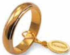
Classica bordi bianchi rodiati Gr. 7,0