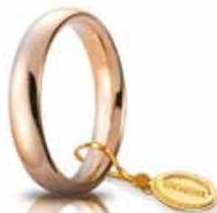
Comoda oro rosso 4 mm