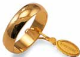
Mantovana oro giallo Gr. 5,0