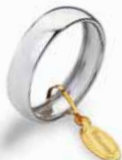
Light 5 mm oro bianco Gr. da 2,6 a 3,0