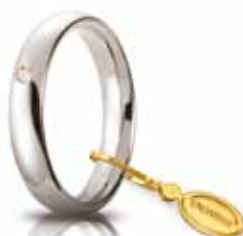
Comoda oro bianco 4 mm ct. 0.03