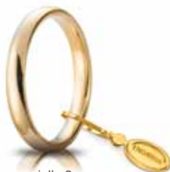
Comoda oro giallo 3 mm