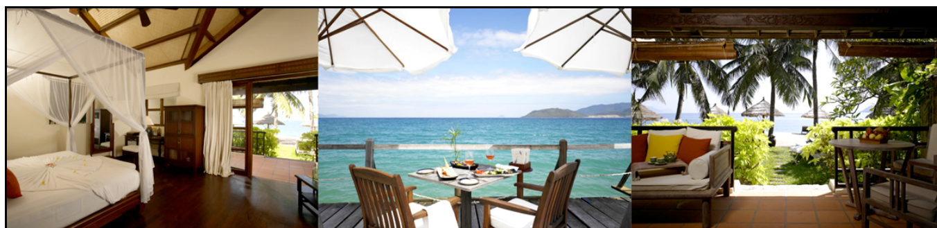
Six Senses Ana Mandara Resort

Pernottamenti al Six Senses Ana Mandara Resort. (Garden View Villa – B)