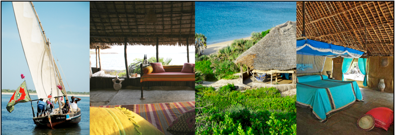
Kiwayu Safari Village