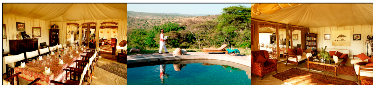
Cottars 1920's Safari Camp

Pernottamento al Cottars 1920's Safari Camp. (FB)