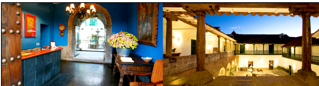
Casa Andina Private Collection Cusco

Pernottamento all’hotel Casa Andina Private Collection Cusco 4*. (B)