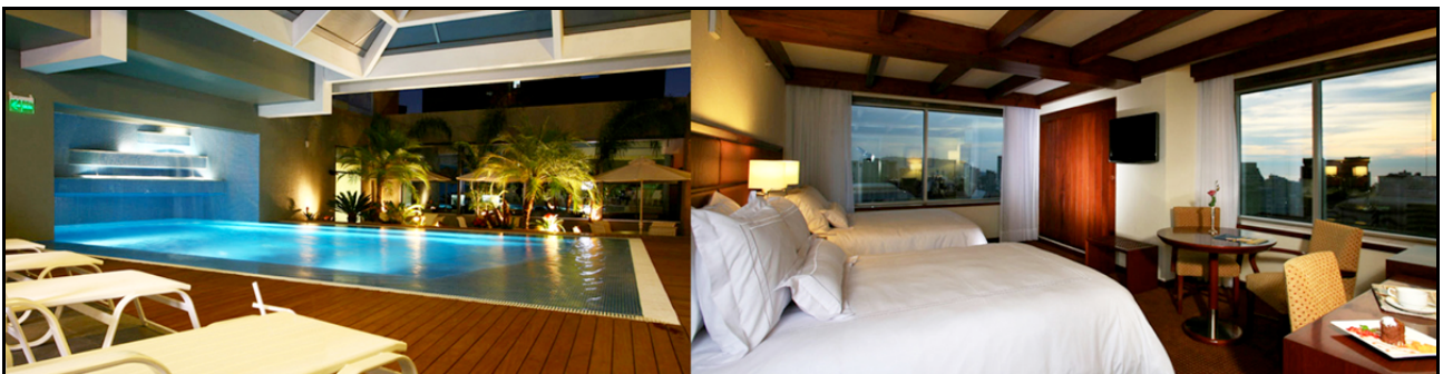
Casa Andina Private Collection Miraflores 5*

Pernottamento all'hotel Casa Andina Private Collection Miraflores 5*.