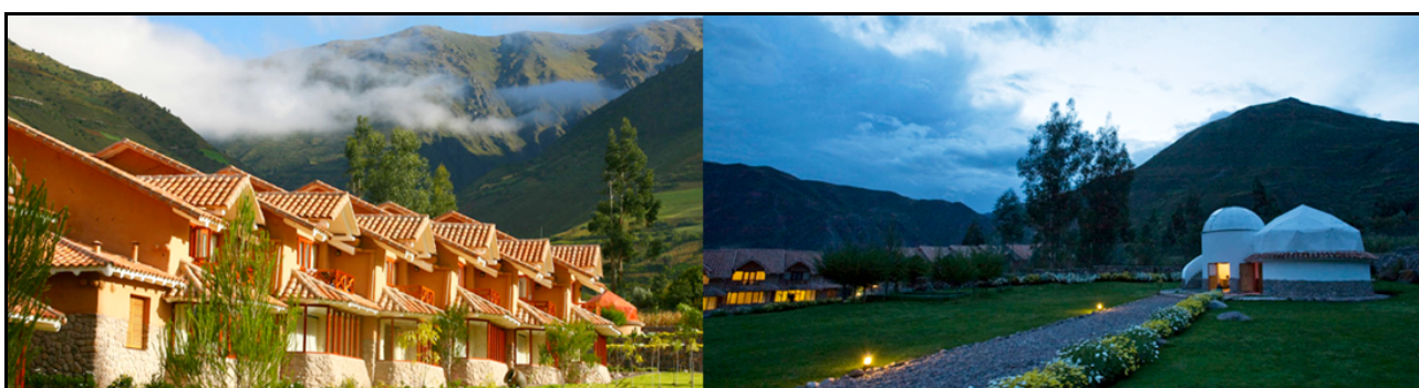
Casa Andina Private Collection Valle

Pernottamento all'hotel Casa Andina Private Collection Valle 4*. (B)